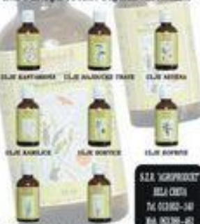
ULJE KANTARIDE ULJE BALNEVINE TRAVE ULJE ANISA ULJE ANGLICE ULJE BONTICE ULJE BONTICE ULJE ANGLICE ULJE BONTICE

S.Z.R. "AGROPRODUKT" BELA CRKVA TEL: 03863-140 BIA: 00338-461