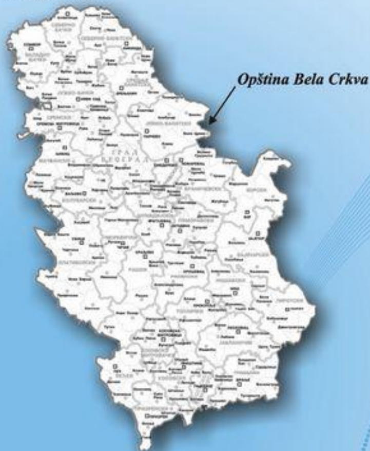
Položaj na karti Republike Srbije

Opština Bela Crkva ima izrazit multietnički karakter. U opštini živi 15.564 Srba, koji predstavljaju ubedljivu etničku većinu opštine (76,8%). Zajedno sa Srbima u Opštini Bela Crkva žive i pripadnici još 20 nacionalnosti: rumunske, češke, romske, mađarske, jugoslovenske, crnogorske, makedonske i drugih etničkih zajednica.