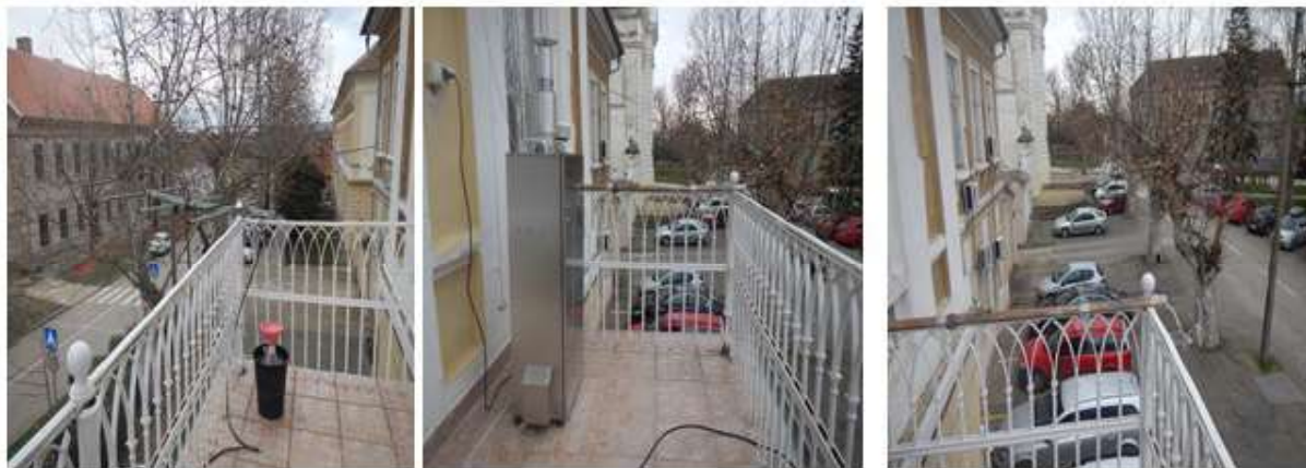
Слика 3. Опрема