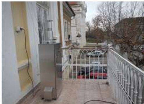
Слика 2. Мерно место Зграда Општинске управе Бела Црква

У 24-часовним узорцима амбијенталног ваздуха свакодневно су одређиване концентрације азот-диоксида на овом мерном месту, а 8 недеља равномерно током целе године одређују се 24-часовне концентрације суспендованих честица фракције PM 10 .