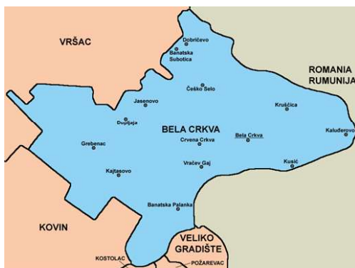
Слика 1. Положај општине Бела Црква

Општина Бела Црква је једна од осам општина јужнобанатског округа. Налази се на надморској висини 89,5m. Заузима површину од 353 km 2 површине. Има око 21.500 хектара ораница. Остали део земљишта чине: ливаде, пашњаци, виногради, воћњаци, шуме и друго. Седиште општине је град Бела Црква. Општини припадају и насељена места: Банатска Паланка, Стара Паланка, Банатска Суботица, Врачев, Гај, Гребенац, Добричево, Дупљаја, Јасеново, Кајтасово, Калуђерово, Крушчица, Кусић, Црвена Црква, Чешко Село. Простире се највећим делом на лесној тераси и алувијалној равни реке Дунав која је значајан пловни пут. На северу је омеђена Вршачким планинама и Делиблатском пешчаром ка западу. Кроз њу пролази река Нера на граници са Румунијом, Караш и канал Дунав—Тиса—Дунав.