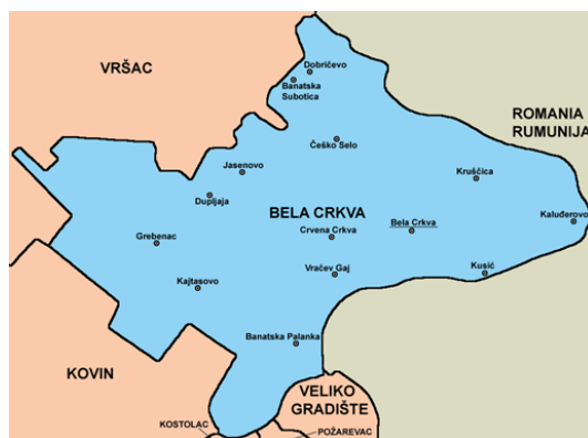
Слика 1. Положај општине Бела Црква

Општина Бела Црква је једна од осам општина јужнобанатског округа. Налази се на надморској висини 89,5m. Заузима површину од 353 km 2 површине. Има око 21.500 хектара ораница. Остали део земљишта чине: ливаде, пашњаци, виногради, воћњаци, шуме и друго. Седиште општине је град Бела Црква. Општини припадају и насељена места: Банатска Паланка, Стара Паланка, Банатска Суботица, Врачев, Гај, Гребенац, Добричево, Дупљаја, Јасеново, Кајтасово, Калуђерово, Крушчица, Кусић, Црвена Црква, Чешко Село. Простире се највећим делом на лесној тераси и алувијалној равни реке Дунав која је значајан пловни пут. На северу је омеђена Вршачким планинама и Делиблатском пешчаром ка западу. Кроз њу пролази река Нера на граници са Румунијом, Караш и канал Дунав—Тиса—Дунав.