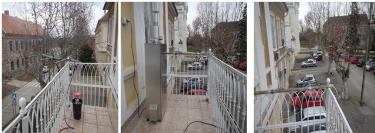
Слика 3. Опрема