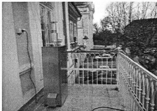
Слика 2. Мерно место Зграда Општинске управе Бела Црква