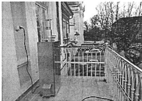
Слика 2. Мерно место Зграда Општинске управе Бела Црква