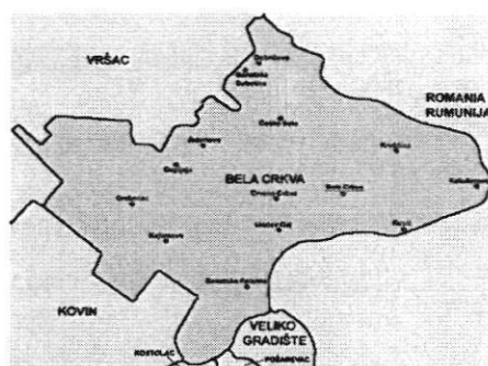
Слика 1. Положај општине Бела Црква

Општина Бела Црква је једна од осам општина јужнобанатског округа. Налази се на надморској висини 89,5m. Заузима површину од 353 km 2 површине. Има око 21.500 хектара ораница. Остали део земљишта чине: ливаде, пашњаци, виногради, воћњаци, шуме и друго. Седиште општине је град Бела Црква. Општини припадају и насељена места: Банатска Паланка, Стара Паланка, Банатска Суботица, Врачев, Гај, Гребенац, Добричево, Дупљаја, Јасеново, Кајтасово, Калуђерово, Крушчица, Кусић, Црвена Црква, Чешко Село. Простире се највећим делом на лесној тераси и алувијалној равни реке Дунав која је значајан пловни пут. На северу је омеђена Вршачким планинама и Делиблатском пешчаром ка западу. Кроз њу пролази река Нера на граници са Румунијом, Караш и канал Дунав—Тиса—Дунав.