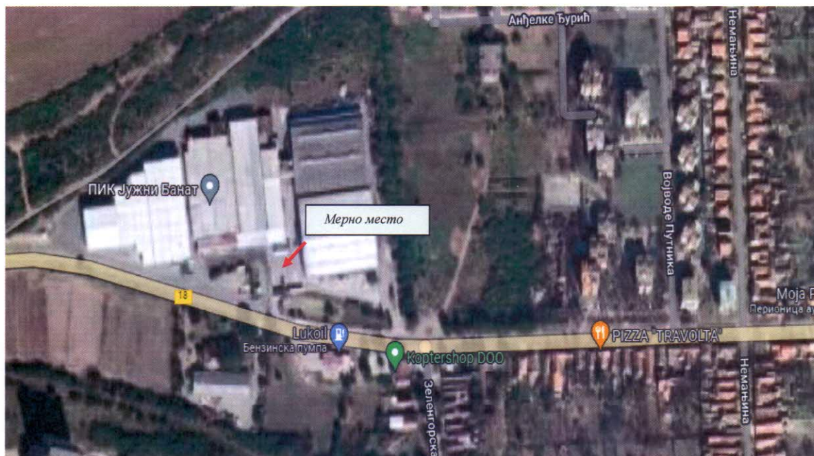
Слика бр.3: Микролокација мерног места у фабрици фабрике „ECO BELFRUIT“ doo Бела Црква

Локација на којој је вршено мерење изабрана је на основу тренутног стања на терену, метеоролошких параметара који су током мерења праћени и уз сагласност инспектора за заштиту животне средине – туристичког инспектора општине Бела Црква.