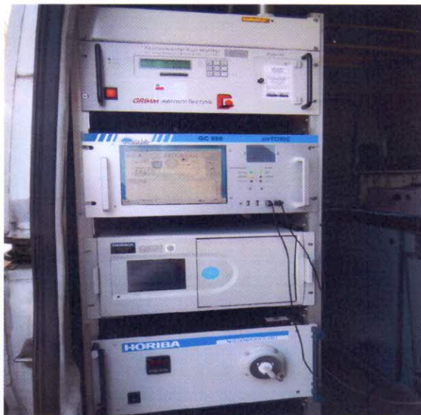
Слика бр.4: Мерни уређаји

Узорковања и мерење концентрације амонијака је вршено аутоматским анализатором смештеним у специјалном возилу. Фотографије мерног уређаја коришћеног за узорковање и мерење приказане су на слици бр.4: