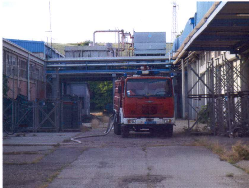
Слика бр. 1: Локација мерног места у кругу фабрике „ECO BELFRUIT“ доо Бела Црква