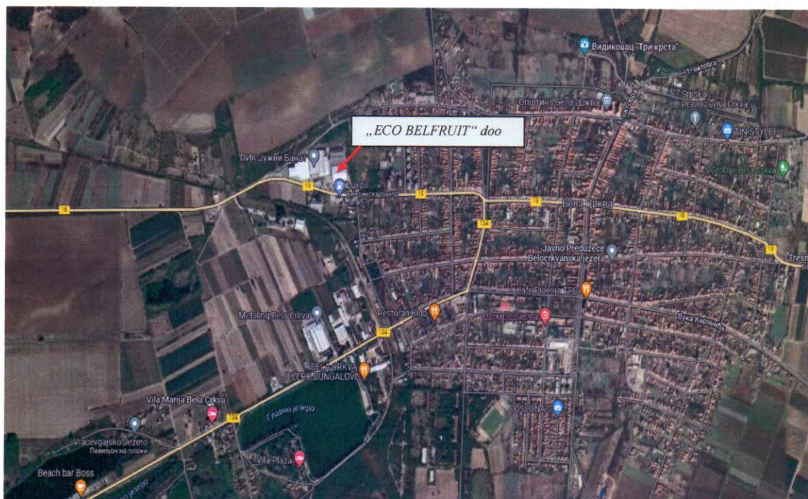
Слика бр.2: Макролокација постројења фабрике „ECO BELFRUIT“ doo Бела Црква.

Макролокација и микролокација акцидента и мерног места приказани су на следећим сликама.