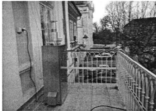
Слика 2. Мерно место Зграда Општинске управе Бела Црква