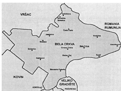
Слика 1. Положај општине Бела Црква

Општина Бела Црква је једна од осам општина јужнобанатског округа. Налази се на надморској висини 89,5m. Заузима површину од 353 km 2 површине. Има око 21.500 хектара ораница. Остали део земљишта чине: ливаде, пашњаци, виногради, воћњаци, шуме и друго. Седиште општине је град Бела Црква. Општини припадају и насељена места: Банатска Паланка, Стара Паланка, Банатска Суботица, Врачев, Гај, Гребенац, Добричево, Дупљаја, Јасеново, Кајтасово, Калуђерово, Крушчица, Кусић, Црвена Црква, Чешко Село. Простире се највећим делом на лесној тераси и алувијалној равни реке Дунав која је значајан пловни пут. На северу је омеђена Вршачким планинама и Делиблатском пешчаром ка западу. Кроз њу пролази река Нера на граници са Румунијом, Караш и канал Дунав—Тиса—Дунав.