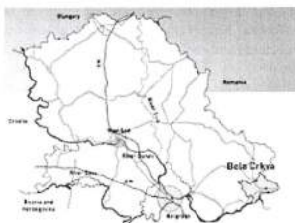
Аутономна Покрајина Војводина -Бела Црква