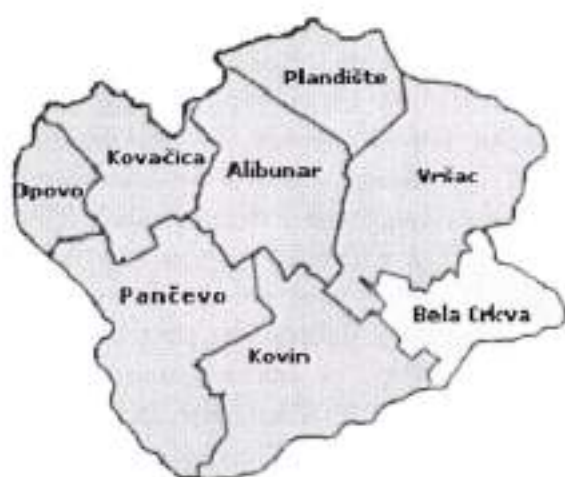
Јужнобанатски управни округ – Бела Црква

Општина Бела Црква налази се у североисточном делу Србије у АП Војводини, у југоисточном делу српског Баната. Простире се на 353 квадратна километра, од чега су 76,7% пољопривредне површине. На југу излази на леву обалу Дунава, на западу и северу се граничи са општинама Ковин и Вршац, а на истоку омеђена је државном границом према Румунији. Општина Бела Црква административно припада Јужнобанатском округу.