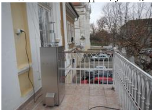
Слика 2. Мерно место Зграда Општинске управе Бела Црква

У 24-часовним узорцима амбијенталног ваздуха свакодневно су одређиване концентрације азот-диоксида на овом мерном месту, а 8 недеља равномерно током целе године одређују се 24-часовне концентрације суспендованих честица фракције PM 10 .