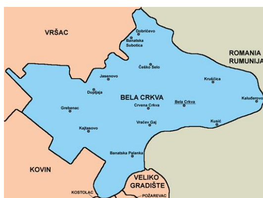
Слика 1. Положај општине Бела Црква

Општина Бела Црква је једна од осам општина јужнобанатског округа. Налази се на надморској висини 89,5m. Заузима површину од 353 km 2 површине. Има око 21.500 хектара ораница. Остали део земљишта чине: ливаде, пашњаци, виногради, воћњаци, шуме и друго. Седиште општине је град Бела Црква. Општини припадају и насељена места: Банатска Паланка, Стара Паланка, Банатска Суботица, Врачев, Гај, Гребенац, Добричево, Дупљаја, Јасеново, Кајтасово, Калуђерово, Крушчица, Кусић, Црвена Црква, Чешко Село. Простире се највећим делом на лесној тераси и алувијалној равни реке Дунав која је значајан пловни пут. На северу је омеђена Вршачким планинама и Делиблатском пешчаром ка западу. Кроз њу пролази река Нера на граници са Румунијом, Караш и канал Дунав—Тиса—Дунав.