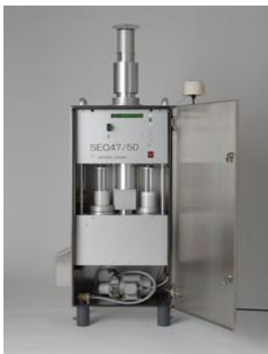
Слика 3. Опрема