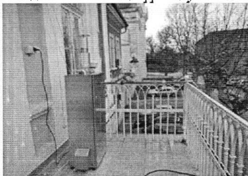
Слика 2. Мерно место Зграда Општинске управе Бела Црква

У 24-часовним узорцима амбијенталног ваздуха свакодневно су одређиване концентрације азот-диоксида на овом мерном месту, а 8 недеља равномерно током целе године одређују се 24-часовне концентрације суспендованих честица фракције PM 10 .