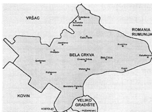
Слика 1. Положај општине Бела Црква

Општина Бела Црква је једна од осам општина јужнобанатског округа. Налази се на надморској висини 89,5m. Заузима површину од 353 km 2 површине. Има око 21.500 хектара ораница. Остали део земљишта чине: ливаде, пашњаци, виногради, воћњаци, шуме и друго. Седиште општине је град Бела Црква. Општини припадају и насељена места: Банатска Паланка, Стара Паланка, Банатска Суботица, Врачев, Гај, Гребенац, Добричево, Дупљаја, Јасеново, Кајтасово, Калуђерово, Крушчица, Кусић, Црвена Црква, Чешко Село. Простире се највећим делом на лесној тераси и алувијалној равни реке Дунав која је значајан пловни пут. На северу је омеђена Вршачким планинама и Делиблатском пешчаром ка западу. Кроз њу пролази река Нера на граници са Румунијом, Караш и канал Дунав—Тиса—Дунав.