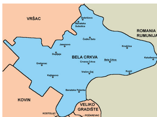
Слика 1. Положај општине Бела Црква

Општина Бела Црква је једна од осам општина јужнобанатског округа. Налази се на надморској висини 89,5m. Заузима површину од 353 km 2 површине. Има око 21.500 хектара ораница. Остали део земљишта чине: ливаде, пашњаци, виногради, воћњаци, шуме и друго. Седиште општине је град Бела Црква. Општини припадају и насељена места: Банатска Паланка, Стара Паланка, Банатска Суботица, Врачев, Гај, Гребенац, Добричево, Дупљаја, Јасеново, Кајтасово, Калуђерово, Крушчица, Кусић, Црвена Црква, Чешко Село. Простире се највећим делом на лесној тераси и алувијалној равни реке Дунав која је значајан пловни пут. На северу је омеђена Вршачким планинама и Делиблатском пешчаром ка западу. Кроз њу пролази река Нера на граници са Румунијом, Караш и канал Дунав—Тиса—Дунав.