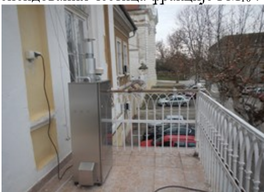
Слика 2. Мерно место Зграда Општинске управе Бела Црква

У 24-часовним узорцима амбијенталног ваздуха свакодневно су одређиване концентрације азот-диоксида на овом мерном месту, а 8 недеља равномерно током целе године одређују се 24-часовне концентрације суспендованих честица фракције PM 10 .