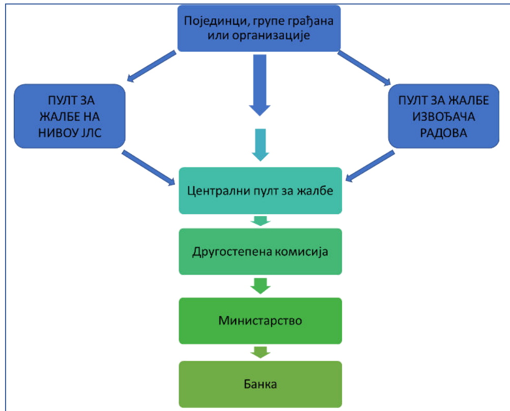
Слика 1. Шема функционисања жалбеног механизма

доноси Другостепена комисија образована решењем министра грађевинарства, саобраћаја и инфраструктуре. Организација ЖМ-а је представљена на слици 1 овог документа.