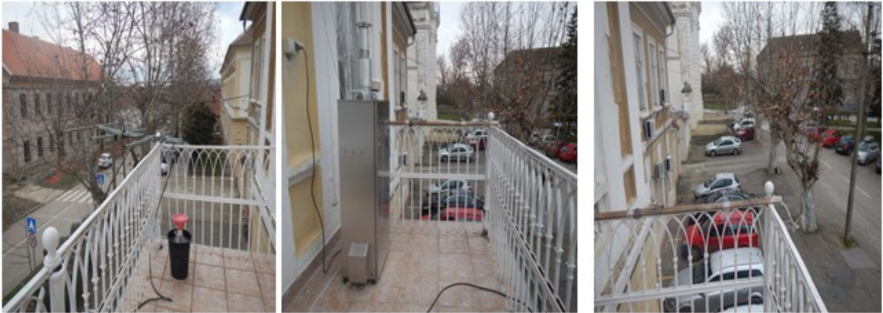
Слика 3. Опрема

Опрема коришћена за узорковање и одређивање концентрација азотдиоксида и суспендованих честица фракције PM_{10} из ваздуха приказана је на слици 3 .