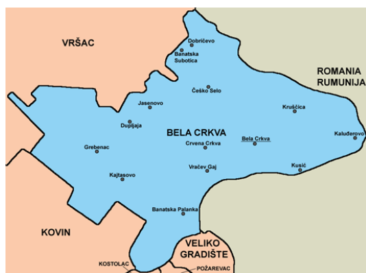
Слика 1. Положај општине Бела Црква

Општина Бела Црква је једна од осам општина јужнобанатског округа. Налази се на надморској висини 89,5m. Заузима површину од 353 km 2 површине. Има око 21.500 хектара ораница. Остали део земљишта чине: ливаде, пашњаци, виногради, воћњаци, шуме и друго. Седиште општине је град Бела Црква. Општини припадају и насељена места: Банатска Паланка, Стара Паланка, Банатска Суботица, Врачев, Гај, Гребенац, Добричево, Дупљаја, Јасеново, Кајтасово, Калуђерово, Крушчица, Кусић, Црвена Црква, Чешко Село. Простире се највећим делом на лесној тераси и алувијалној равни реке Дунав која је значајан пловни пут. На северу је омеђена Вршачким планинама и Делиблатском пешчаром ка западу. Кроз њу пролази река Нера на граници са Румунијом, Караш и канал Дунав—Тиса—Дунав.