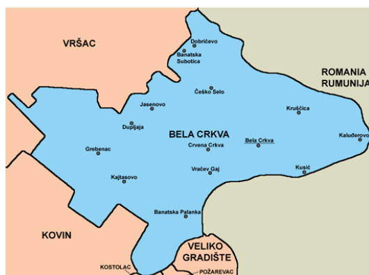
Слика 1. Положај општине Бела Црква

Општина Бела Црква је једна од осам општина јужнобанатског округа. Налази се на надморској висини 89,5m. Заузима површину од 353 km 2 површине. Има око 21.500 хектара ораница. Остали део земљишта чине: ливаде, пашњаци, виногради, воћњаци, шуме и друго. Седиште општине је град Бела Црква. Општини припадају и насељена места: Банатска Паланка, Стара Паланка, Банатска Суботица, Врачев, Гај, Гребенац, Добричево, Дупљаја, Јасеново, Кајтасово, Калуђерово, Крушчица, Кусић, Црвена Црква, Чешко Село. Простире се највећим делом на лесној тераси и алувијалној равни реке Дунав која је значајан пловни пут. На северу је омеђена Вршачким планинама и Делиблатском пешчаром ка западу. Кроз њу пролази река Нера на граници са Румунијом, Караш и канал Дунав—Тиса—Дунав.