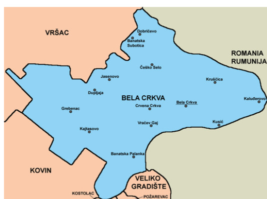
Слика 1. Положај општине Бела Црква

Општина Бела Црква је једна од осам општина јужнобанатског округа. Налази се на надморској висини 89,5m. Заузима површину од 353 km 2 површине. Има око 21.500 хектара ораница. Остали део земљишта чине: ливаде, пашњаци, виногради, воћњаци, шуме и друго. Седиште општине је град Бела Црква. Општини припадају и насељена места: Банатска Паланка, Стара Паланка, Банатска Суботица, Врачев, Гај, Гребенац, Добричево, Дупљаја, Јасеново, Кајтасово, Калуђерово, Крушчица, Кусић, Црвена Црква, Чешко Село. Простире се највећим делом на лесној тераси и алувијалној равни реке Дунав која је значајан пловни пут. На северу је омеђена Вршачким планинама и Делиблатском пешчаром ка западу. Кроз њу пролази река Нера на граници са Румунијом, Караш и канал Дунав—Тиса—Дунав.